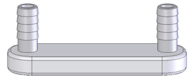
Réacteur Retrokit® Nano-Pro, montage extérieur au tube d'échappement